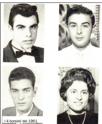
I 4 borsisti del 1961